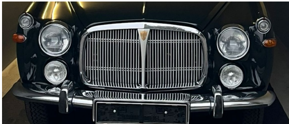
WFT5 - Rover P5B

Austausch auch einzeln vorgenommen werden kann, ohne zu riskieren, dass das linke sich vom rechten unterscheidet.